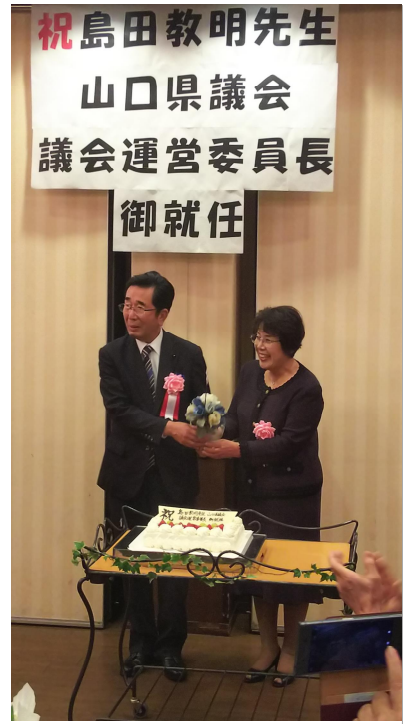
島田先生、りつご夫妻ケーキ入刀

令和元年11月2日19時より防府市の割烹いちほなで、島田教明山口県議会議員の議会運営委員長就任祝賀会を開催しました。司会